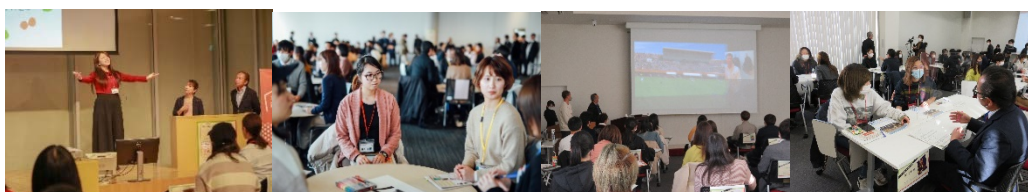
【※合同 JIBUN 説明会 / JIBUN コンテストの様子】

過去のイベント⇒ https://miraiken.yamanashi.jp/jibun/