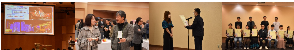
【※アイデアコンテスト&交流会&表彰式の様子】

※過去のイベント⇒ https://miraiken.yamanashi.jp/realfunding/