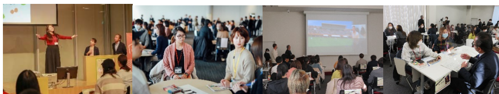
【※合同 JIBUN 説明会 / JIBUN コンテストの様子】

過去のイベント⇒ https://miraiken.yamanashi.jp/jibun/